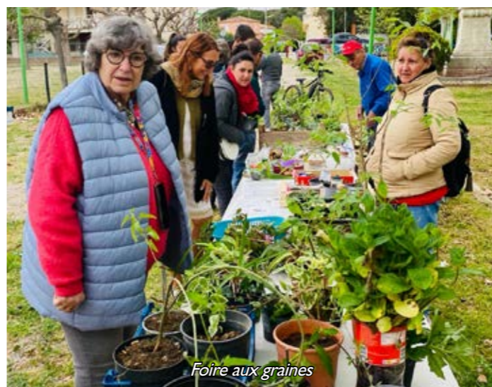
Foire aux graines