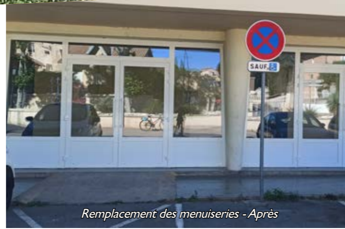
Remplacement des menuiseries - Après