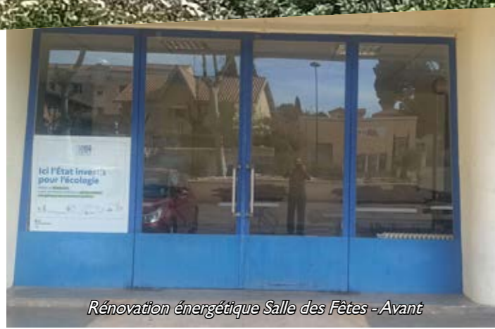
Rénovation énergétique Salle des Fêtes - Avant