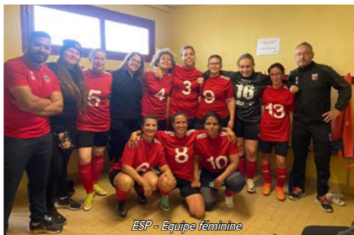
ESP - Equipe féminine