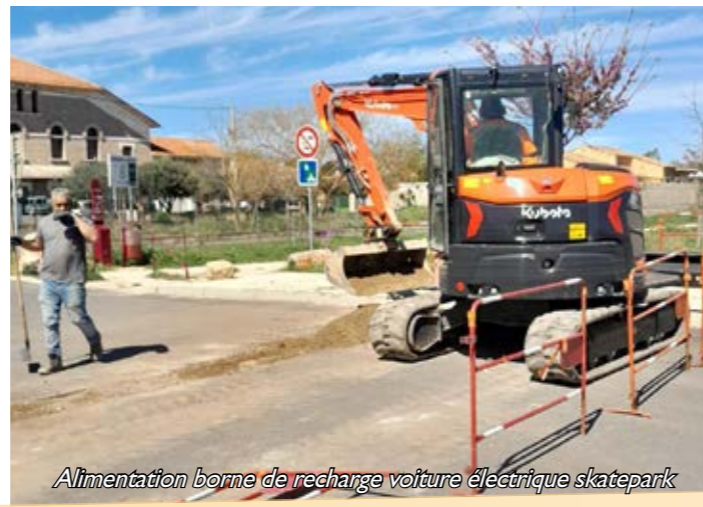
Alimentation borne de recharge voiture électrique skatepark