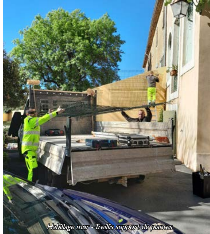
Habillage mur - Treillis support de plantes