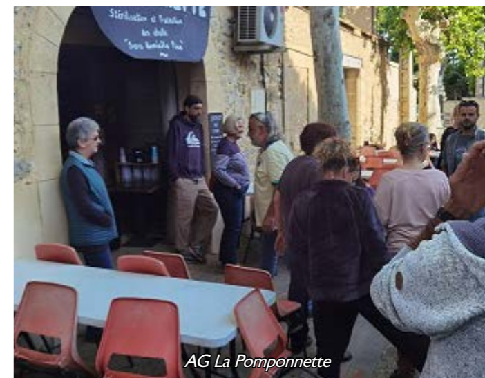
AG La Pomponnette