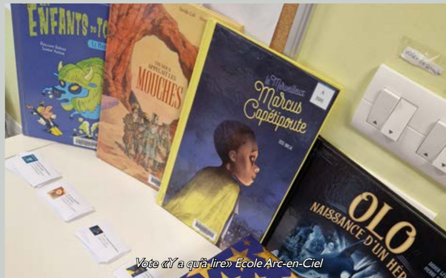
Vote «Y'a qu'à lire» Ecole Arc-en-Ciel

Ciné surprise enfant tous les lundis à 14h30