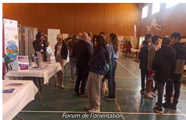
Forum de l'orientation