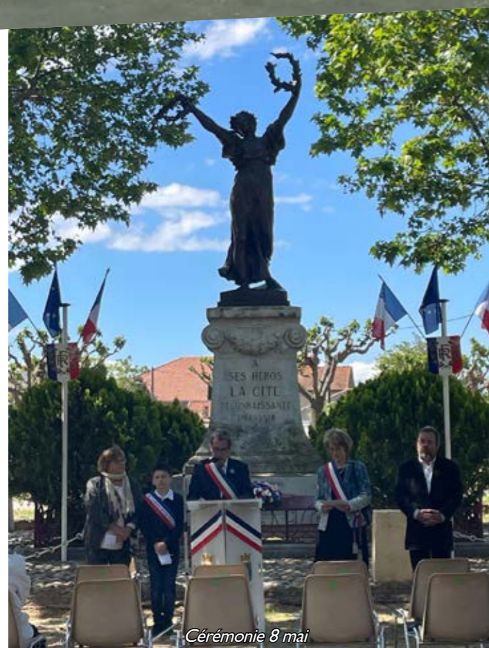
Cérémonie 8 mai