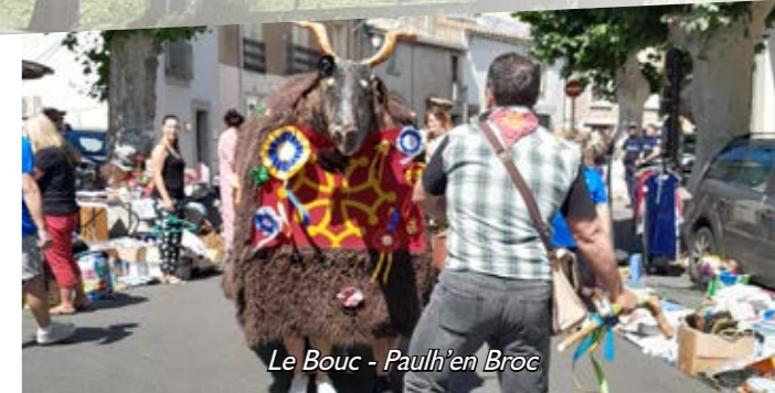
Le Bouc - Paulh'en Broc