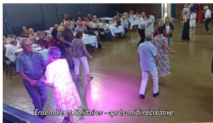
Ensemble et Solidaires - après-midi récréative