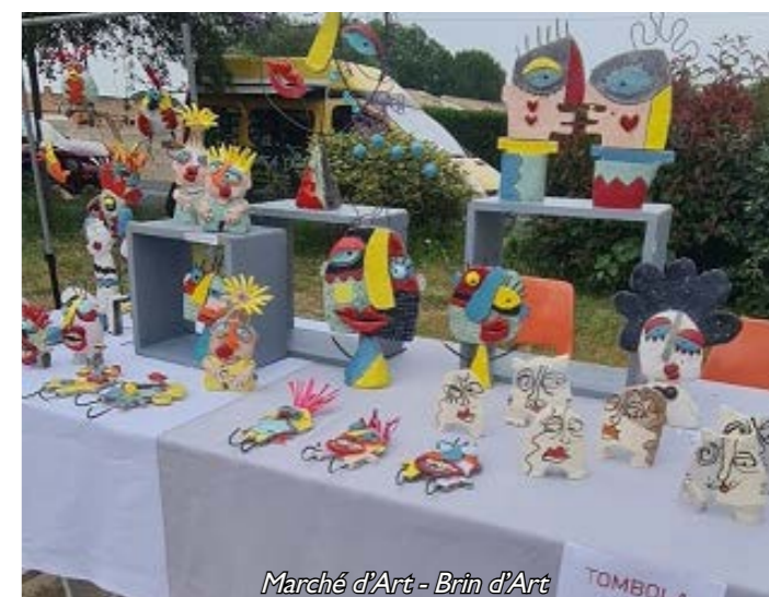
Marché d'Art - Brin d'Art