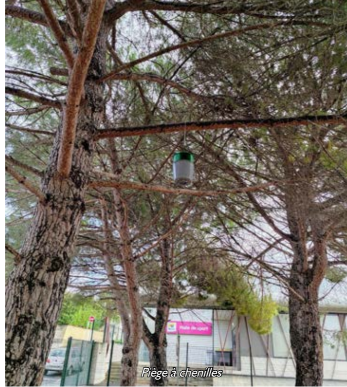
Piège à chenilles