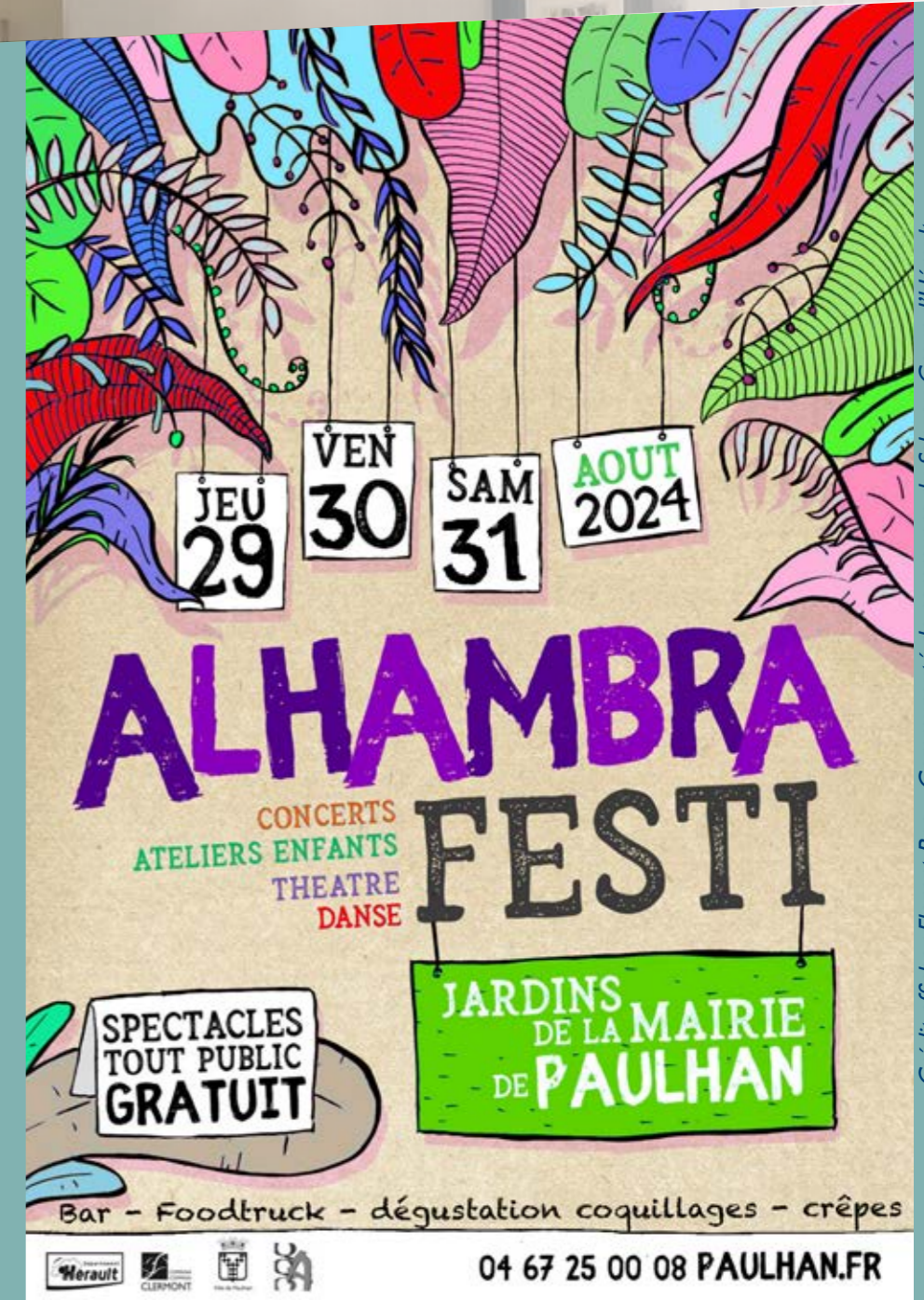
Crédit affiche : Florent Bec - Communauté de communes du Salagou Cœur d'Hérault