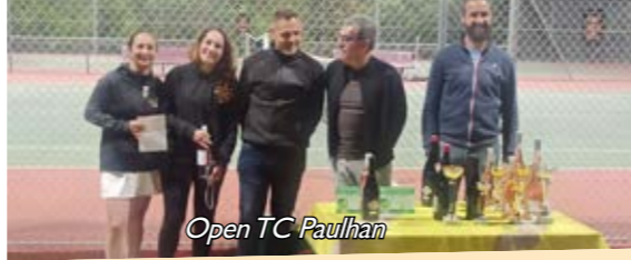
Open TC Paulhan