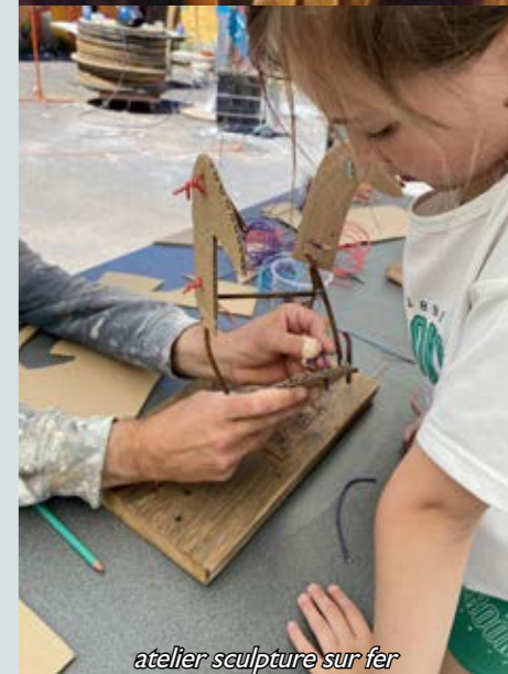
atelier sculpture sur fer