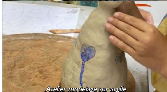
Atelier modelage sur argile