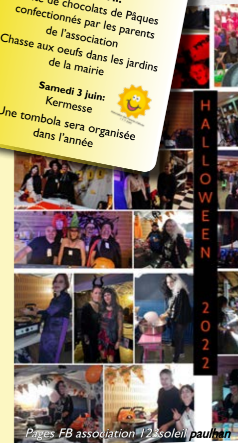
Pages FB association 123soleil paulhan