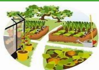
Jardins Route de Clermont