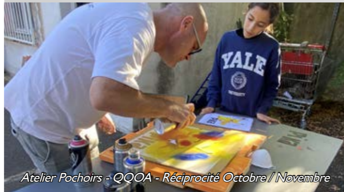
Atelier Pochoirs - QOQA - Réciprocité Octobre / Novembre