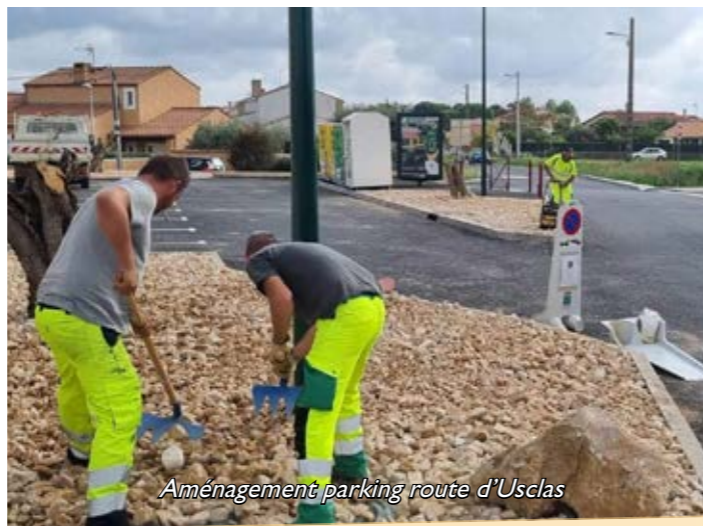
Aménagement parking route d'Usclas