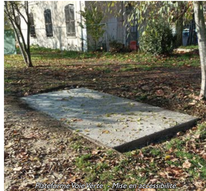
Plateforme Voie Verte - Mise en accessibilité