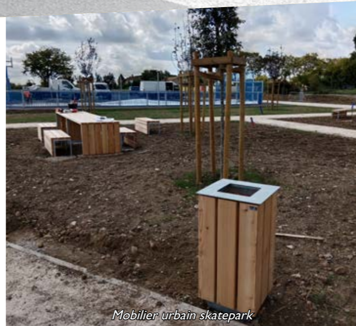
Mobilier urbain skatepark