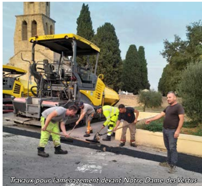
Travaux pour l'aménagement devant Notre Dame des Vertus