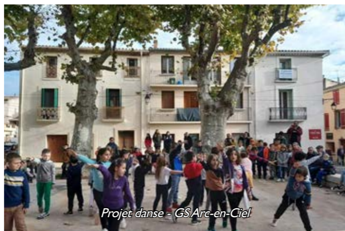
Projet danse - GS Arc-en-Ciel