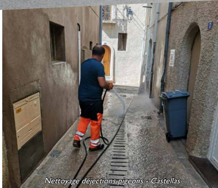
Nettoyage déjections pigeons - Castellas