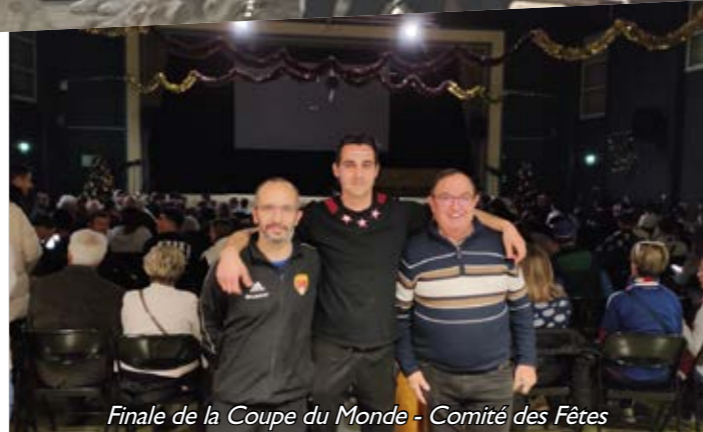
Finale de la Coupe du Monde - Comité des Fêtes