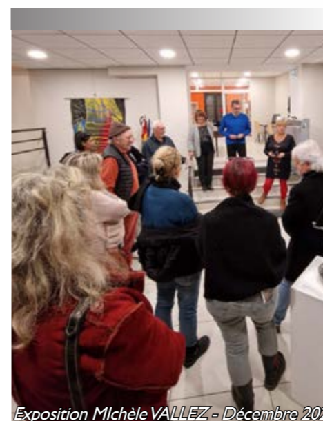
Exposition Michèle VALLEZ - Décembre 2022

A partir de 9 ans – Sur inscription - Gratuit