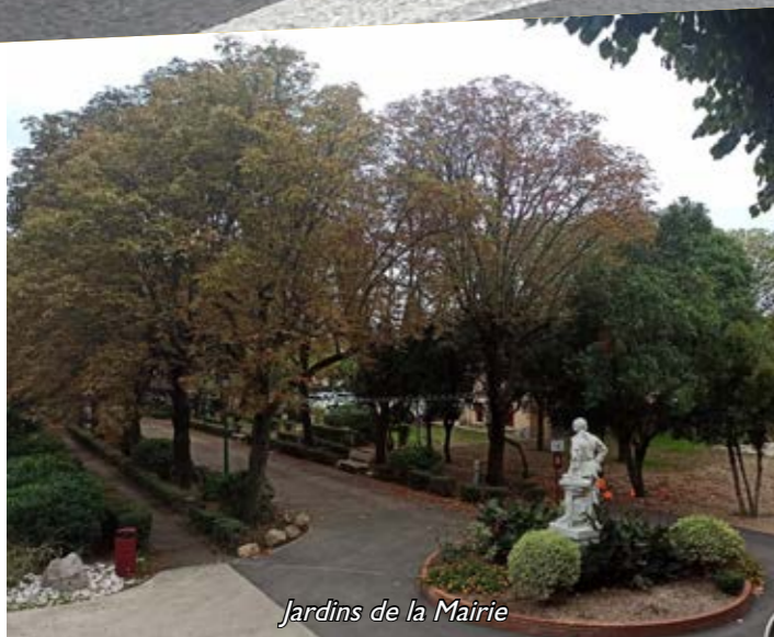
Jardins de la Mairie

effectués en régie municipale ou par des entreprises