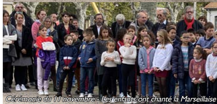
Cérémonie du 11 novembre - Les enfants ont chanté la Marseillaise