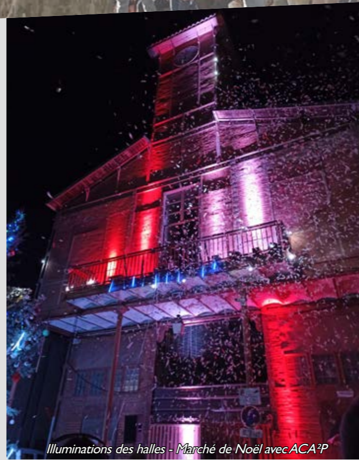
Illuminations des halles - Marché de Noël avec ACA?P