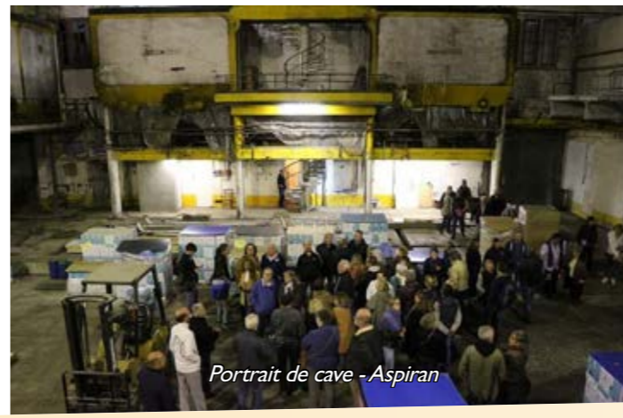
Portrait de cave - Aspiran