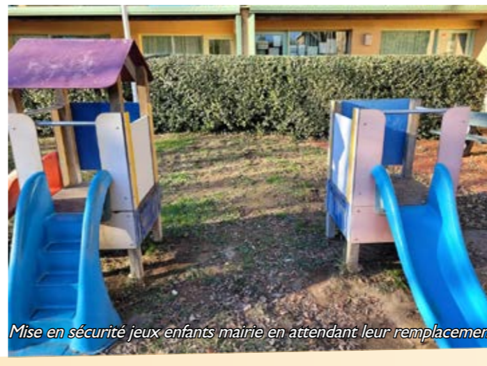
Mise en sécurité jeux enfants mairie en attendant leur remplacement