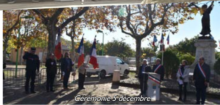
Cérémonie 5 décembre