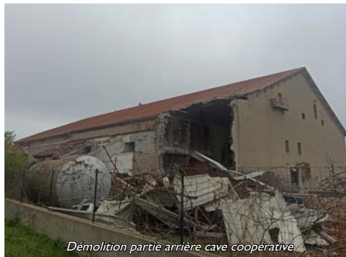
Démolition partie arrière cave coopérative