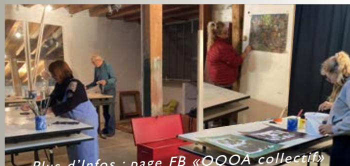
Plus d'Infos : page FB «QQOA collectif»

Le 21 juin = Fête de la musique: vous êtes musicien? venez participer librement au tremplin (sur inscription)