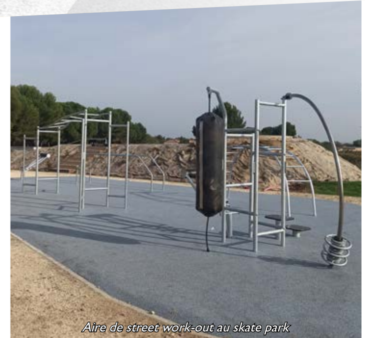
Aire de street work-out au skate park