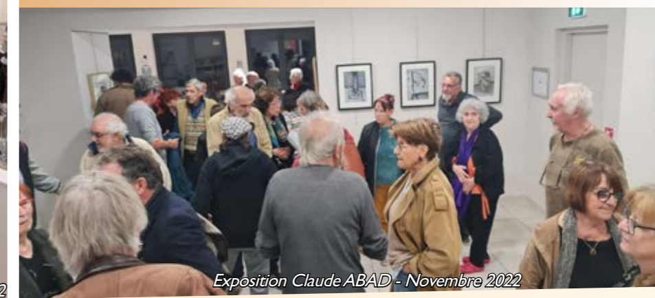
Exposition Claude ABAD - Novembre 2022