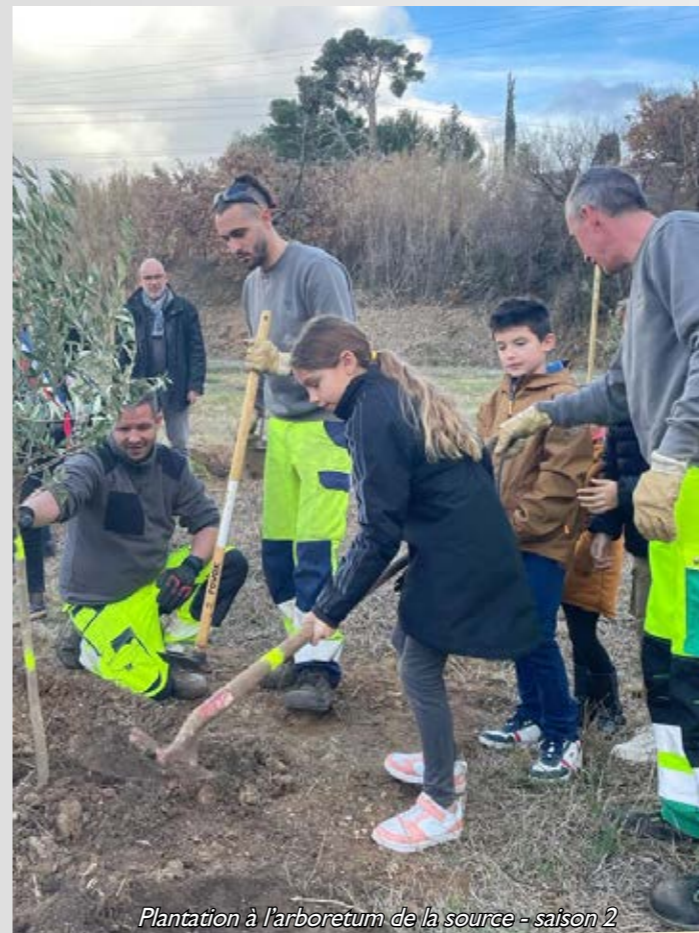
Plantation à l'arboretum de la source - saison 2