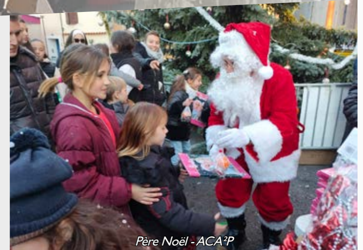
Père Noël - ACA?P