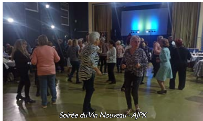
Soirée du Vin Nouveau - AJPK