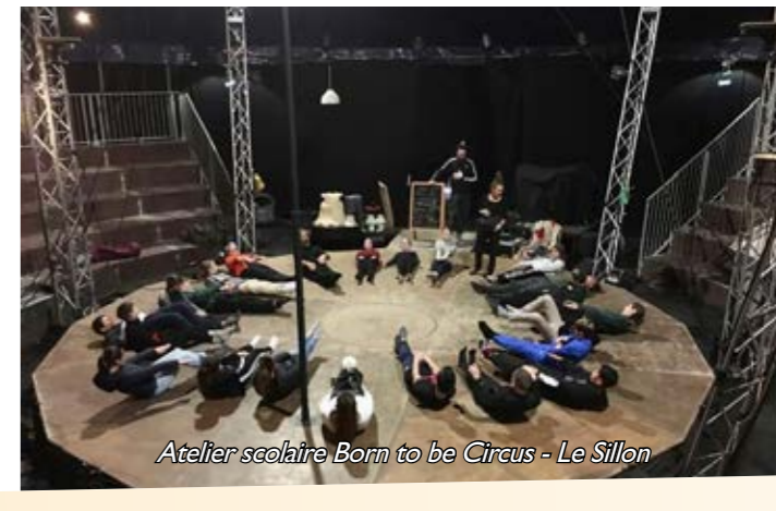
Atelier scolaire Born to be Circus - Le Sillon