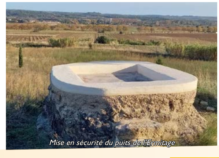
Mise en sécurité du puits de l'Ermitage