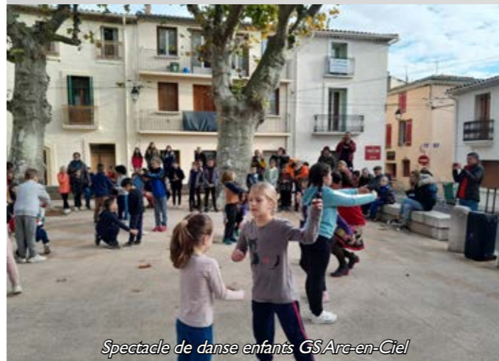
Spectacle de danse enfants GS Arc-en-Ciel