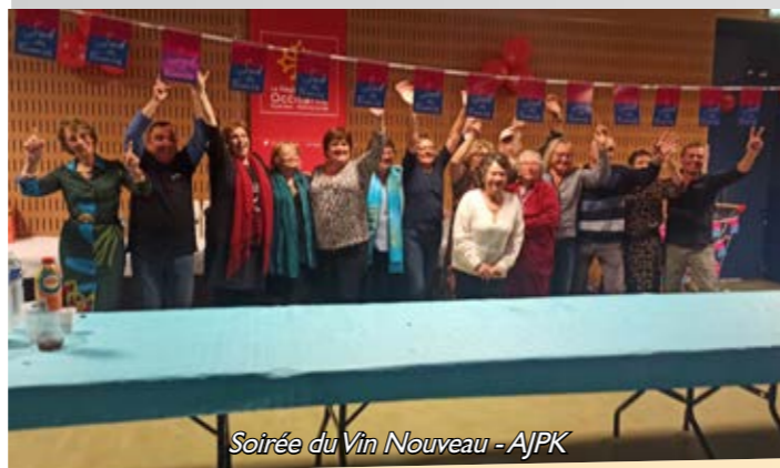
Soirée du Vin Nouveau - AJPK