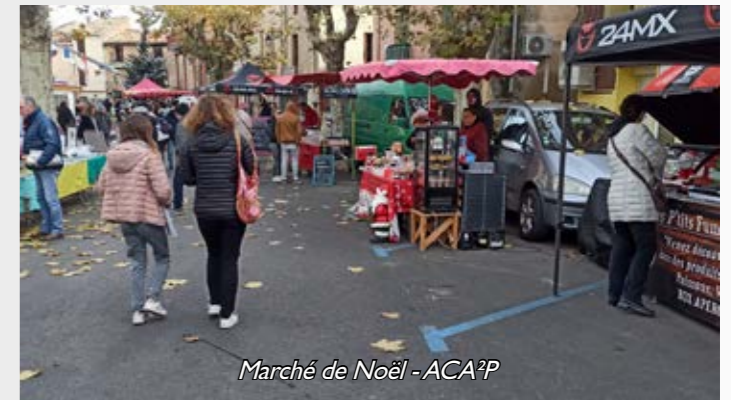
Marché de Noël - ACA?P