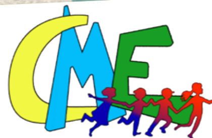
Conseil Municipal des Enfants - Ville de PAULHAN

Le 26 décembre dernier, 266 enfants des centres de loisirs de Clermont, Ceyras, Paulhan, Nébian, Fontès et Canet ont assisté à la Salle des fêtes de Paulhan à un spectacle interactif sur le thème de Noël. A cette occasion, le Père Noël est venu les rencontrer et leur offrir des chocolats.