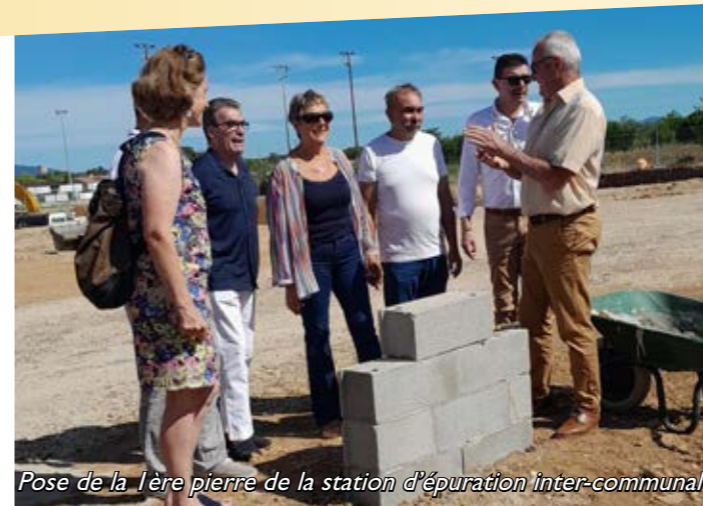
Pose de la 1ère pierre de la station d'épuration inter-communale