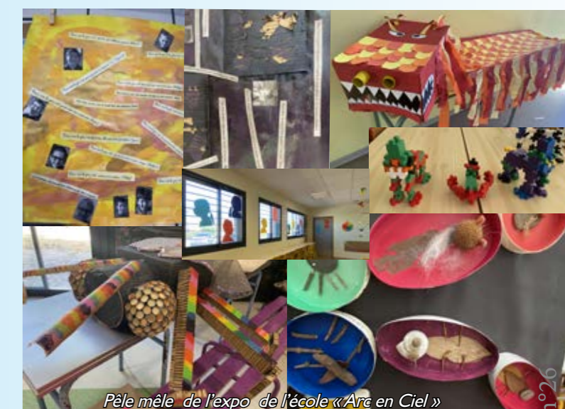
Pêle mêle de l'expo de l'école « Arc en Ciel »