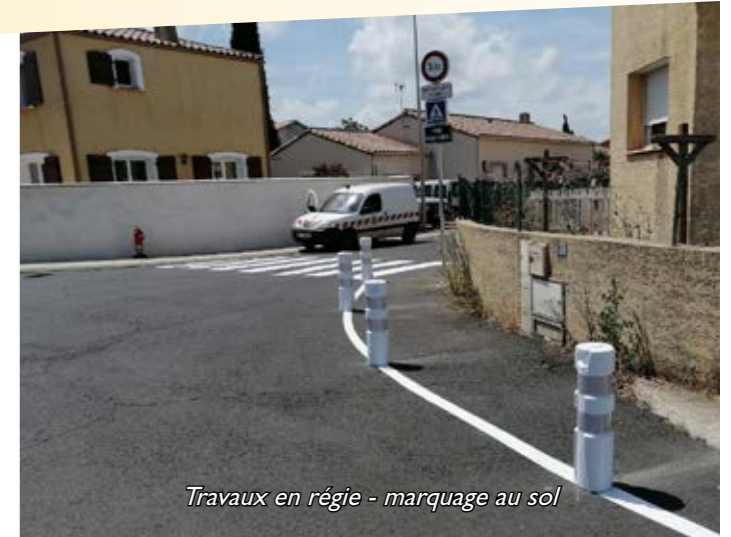
Travaux en régie - marquage au sol