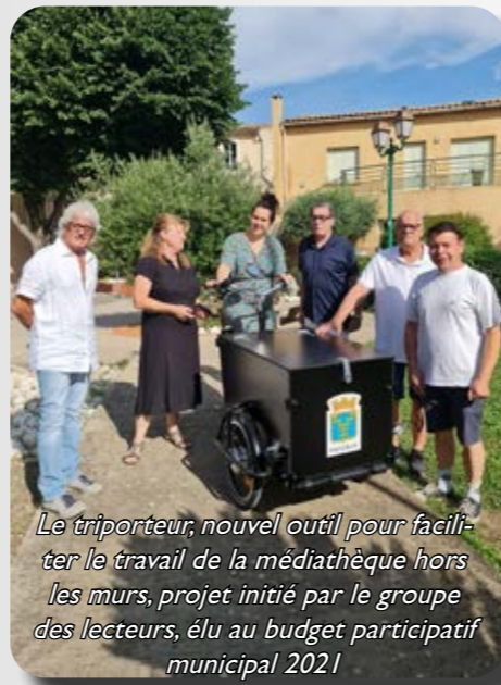
Le triporteur, nouvel outil pour faciliter le travail de la médiathèque hors les murs, projet initié par le groupe des lecteurs, élu au budget participatif municipal 2021