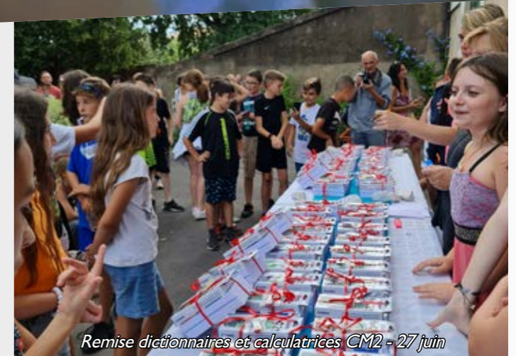
Remise dictionnaires et calculatrices CM2 - 27 juin