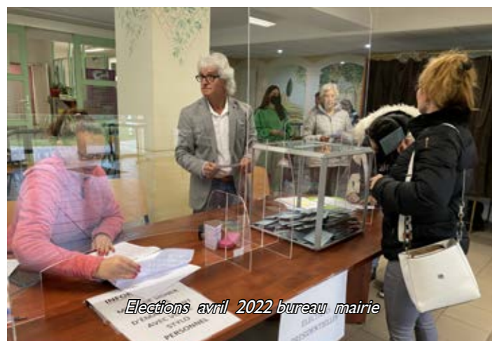
Elections avril 2022 bureau mairie