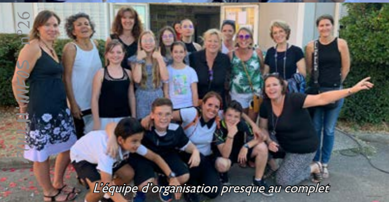
L'équipe d'organisation presque au complet