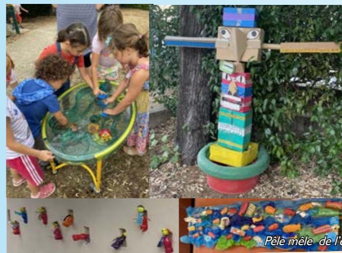
Pêle mêle de l'expo de l'école « Dolto »