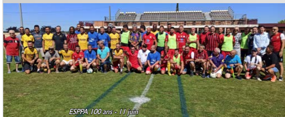
ESPPA 100 ans - 11 juin