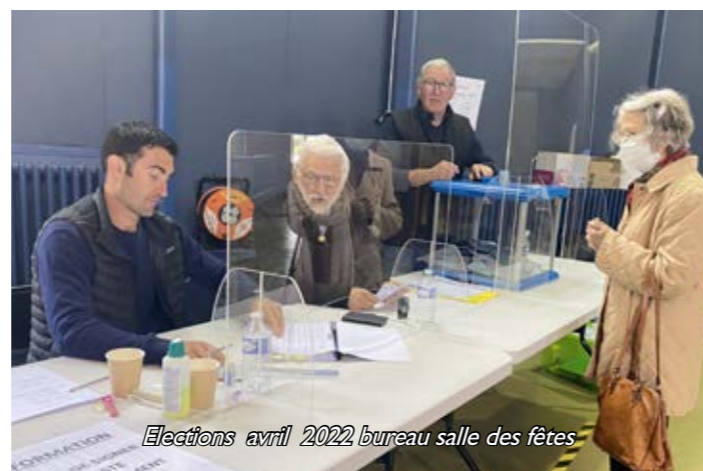
Elections avril 2022 bureau salle des fêtes