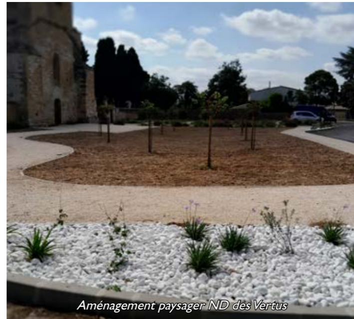
Aménagement paysager ND des Vertus