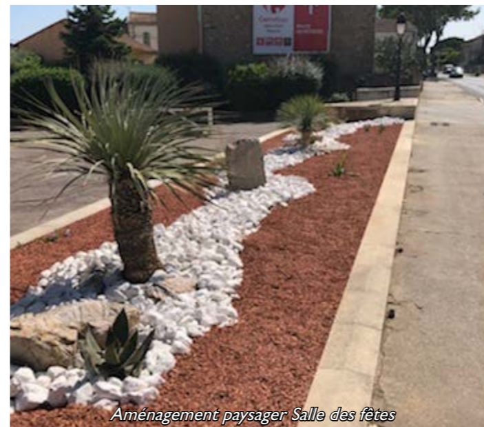
Aménagement paysager Salle des fêtes