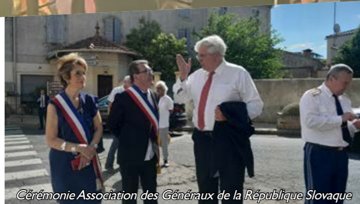
Cérémonie Association des Généraux de la République Slovaque