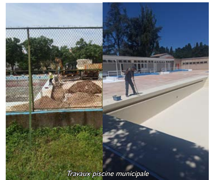
Travaux piscine municipale