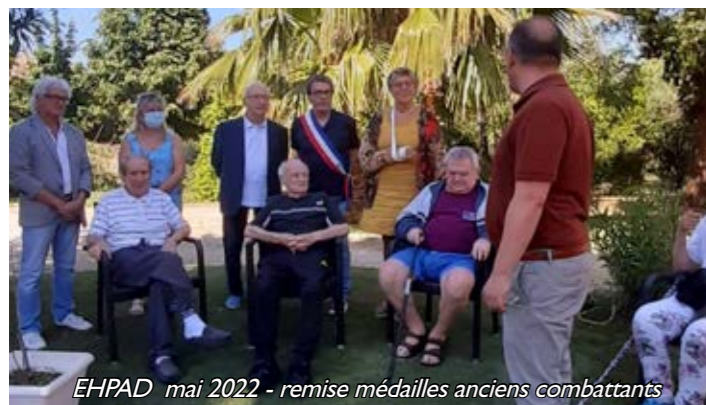
EHPAD mai 2022 - remise médailles anciens combattants