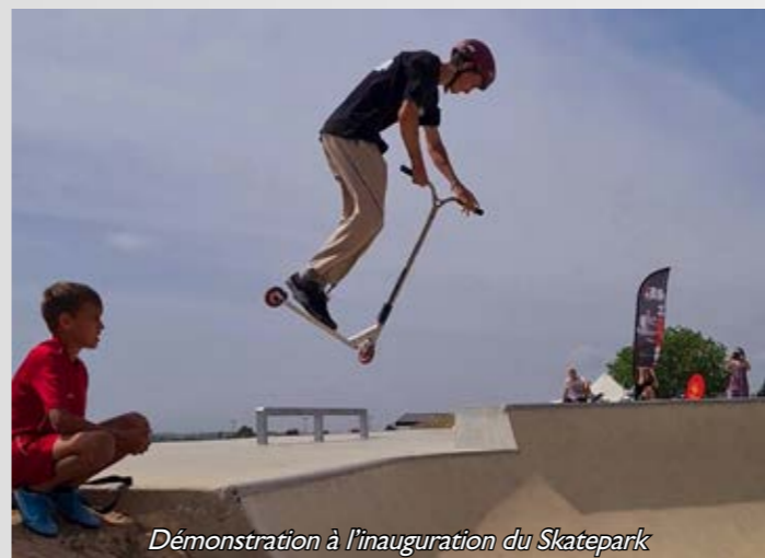
Démonstration à l'inauguration du Skatepark