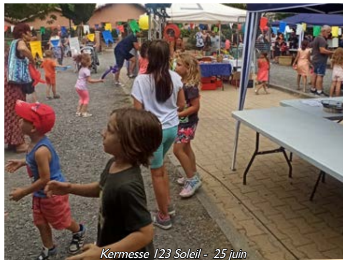
Kermesse 123 Soleil - 25 juin