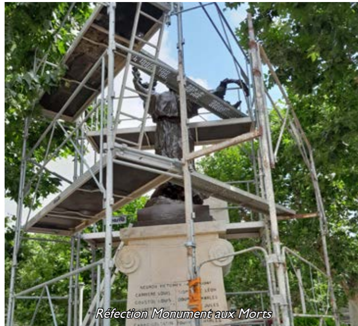
Réfection Monument aux Morts