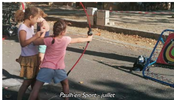
Paulh'en Sport - juillet