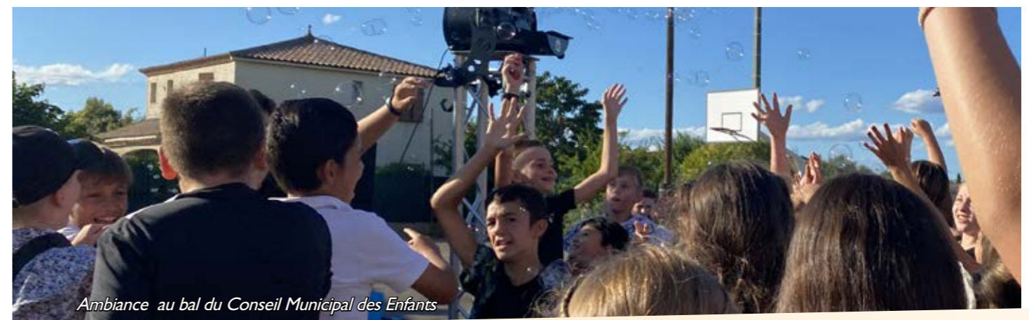
Ambiance au bal du Conseil Municipal des Enfants