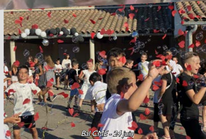
Bal CME - 24 juin