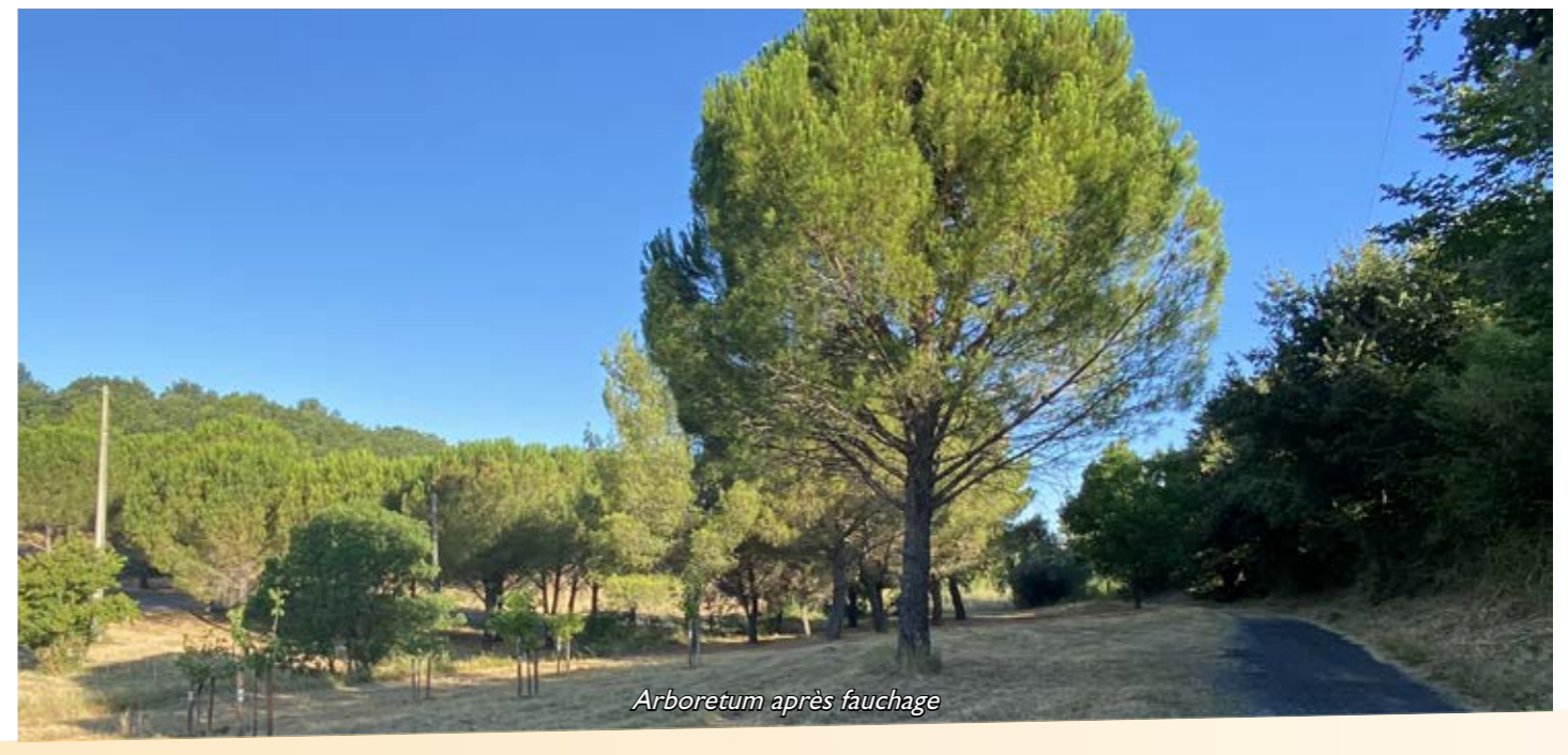
Arboretum après fauchage