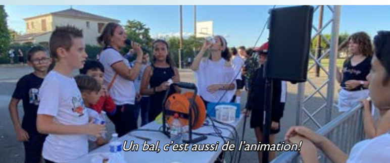
Un bal, c'est aussi de l'animation!

Un grand merci à tous ceux qui ont soutenu ce projet : les élus, les parents et l'association 1,2,3 Soleil, le personnel municipal et les enseignants ; aux élus du CME pour leur engagement , leur dynamique et leur bonne humeur !