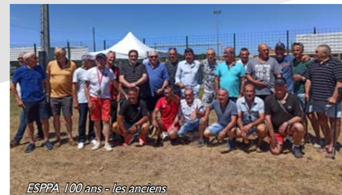
ESPPA 100 ans - les anciens