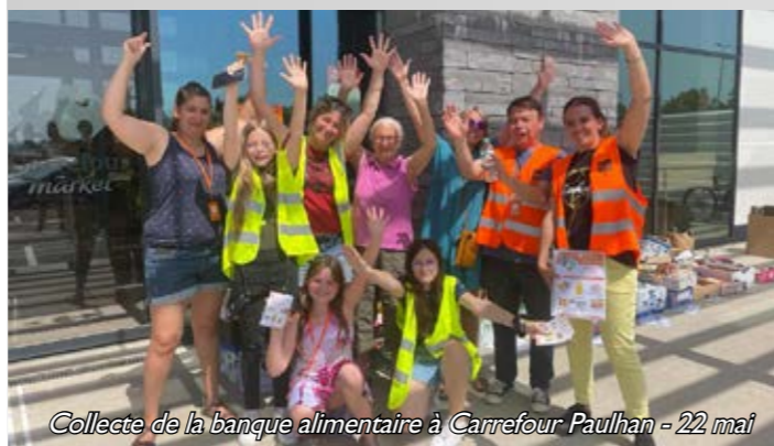
Collecte de la banque alimentaire à Carrefour Paulhan - 22 mai