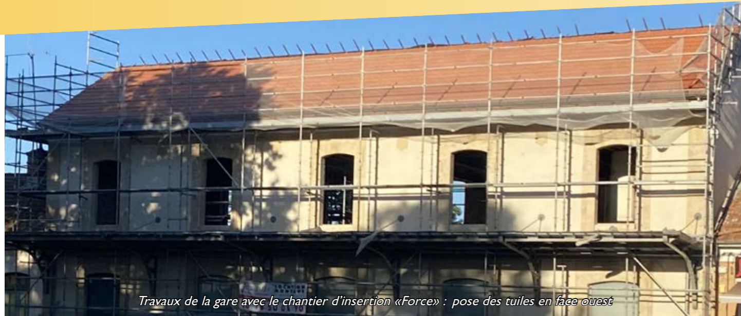
Travaux de la gare avec le chantier d'insertion «Force» : pose des tuiles en face ouest

effectués en régie municipale, par des entreprises ou par le chantier d'insertion (gare).