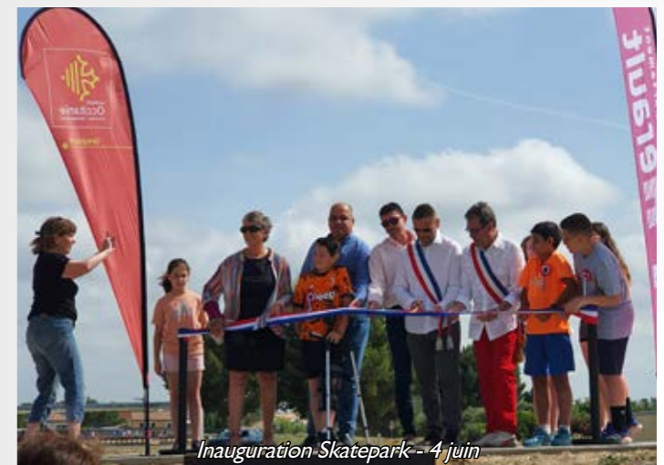
Inauguration Skatepark - 4 juin