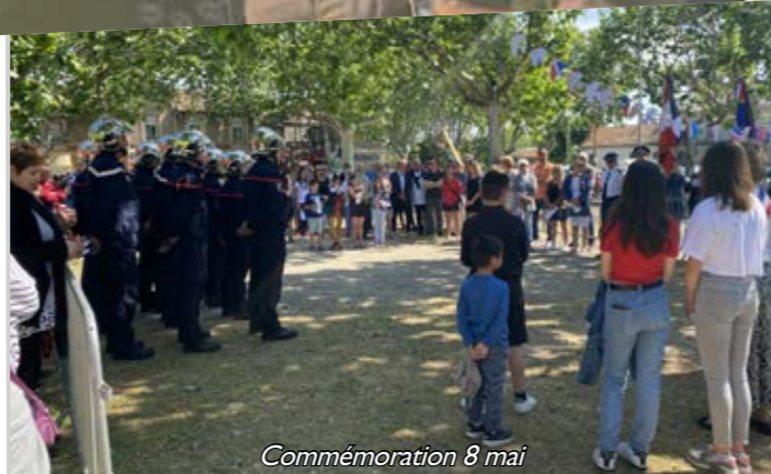
Commemoration 8 mai