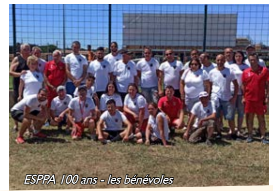
ESPPA 100 ans - les bénévoles