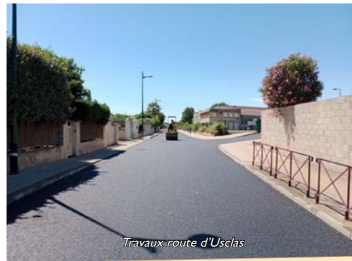
Travaux route d'Usclas