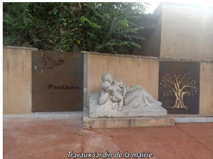
Travaux jardin de la mairie