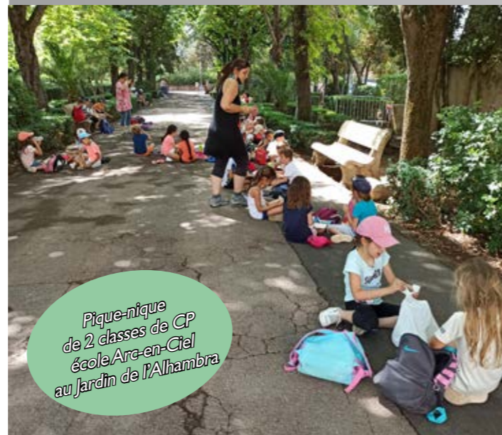
Pique-nique de 2 classes de CP école Arc-en-Ciel au Jardin de l'Alhambra