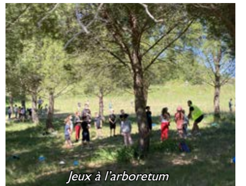
Jeux à l'arboretum