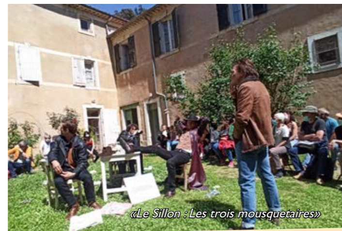
«Le Sillon : Les trois mousquetaires»