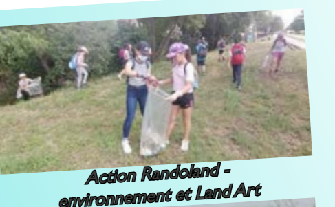
Action Randoland - environnement et Land Art