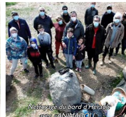
Nettoyage du bord d'Hérault avec «ANIMAGOU»