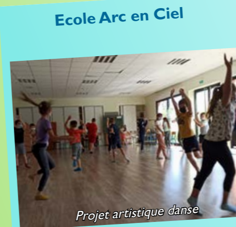
Projet artistique danse