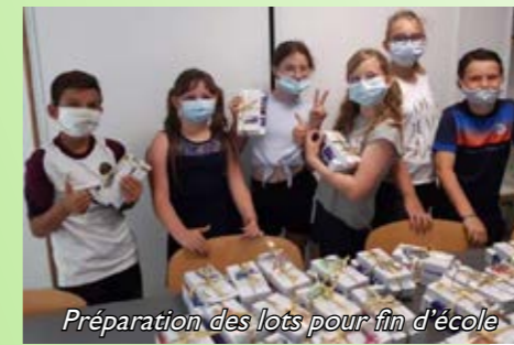
Préparation des lots pour fin d'école