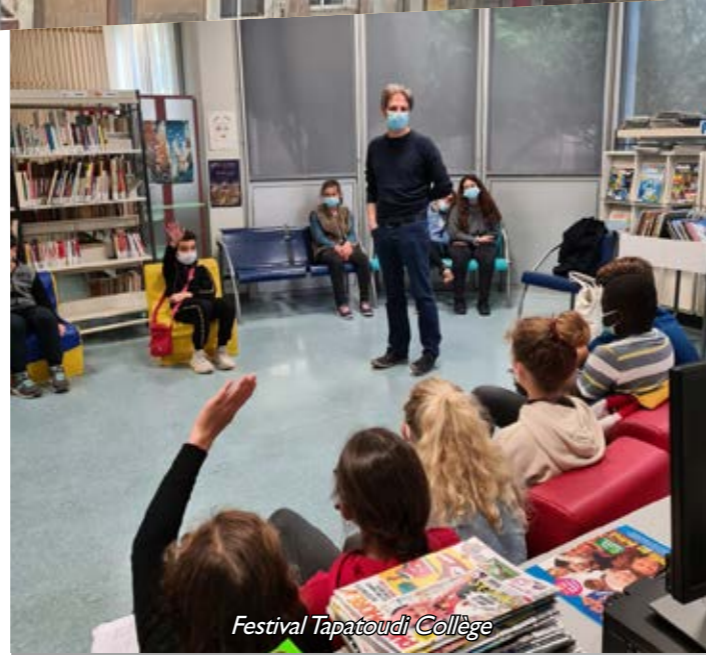
Festival Tapatoudi Collège