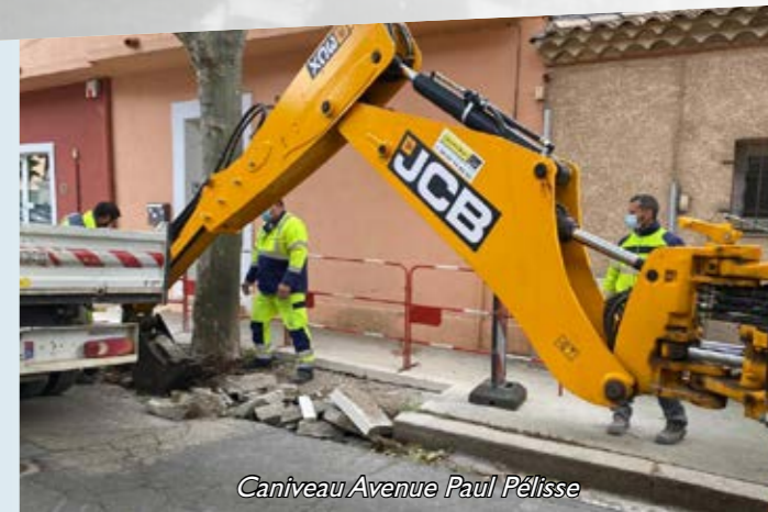
Caniveau Avenue Paul Pélisse