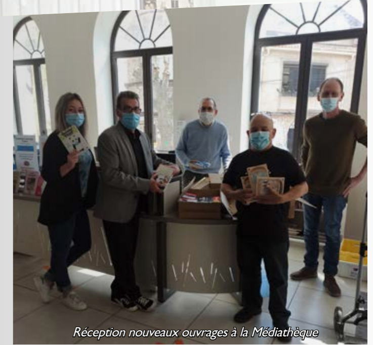
Réception nouveaux ouvrages à la Médiathèque