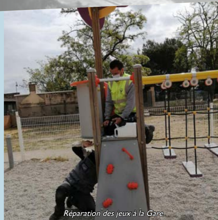
Réparation des jeux à la Gare

Les dates seront précisées sur les supports de communication de la commune.