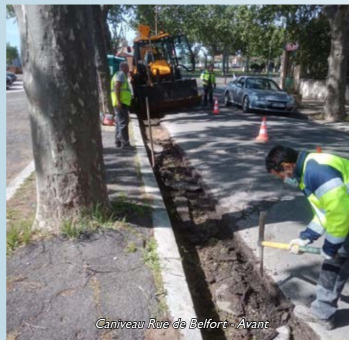
Caniveau Rue de Belfort - Avant