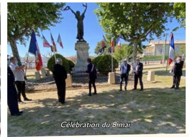
Célébration du 8 mai