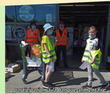
participation à la banque alimentaire

Merci à tous pour votre assiduité et votre persévérance qui sont des clés pour la réalisation de vos idées.