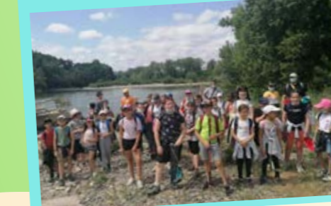
Action Randoland - environnement et Land Art