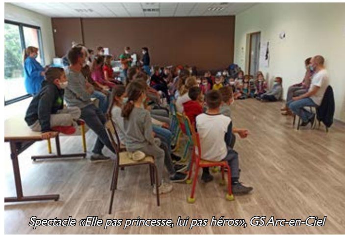
Spectacle «Elle pas princesse, lui pas héros», GS Arc-en-Ciel