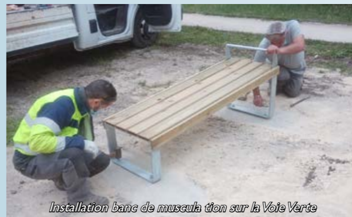
Installation banc de musculation sur la Voie Verte