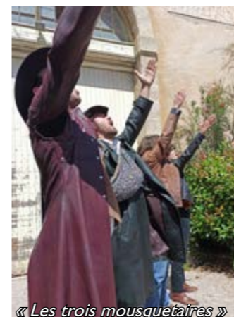
« Les trois mousquetaires »