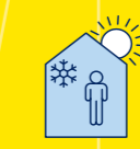
RESTEZ AU FRAIS