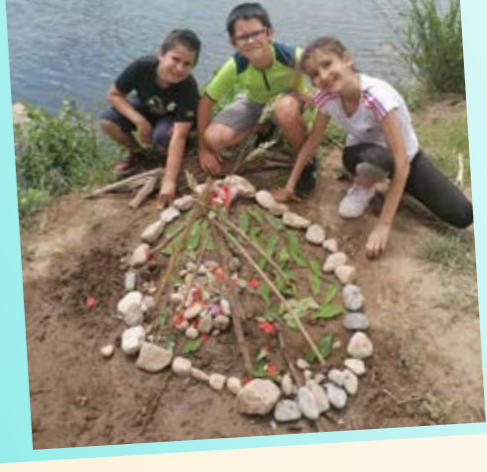
Action Randoland - environnement et Land Art