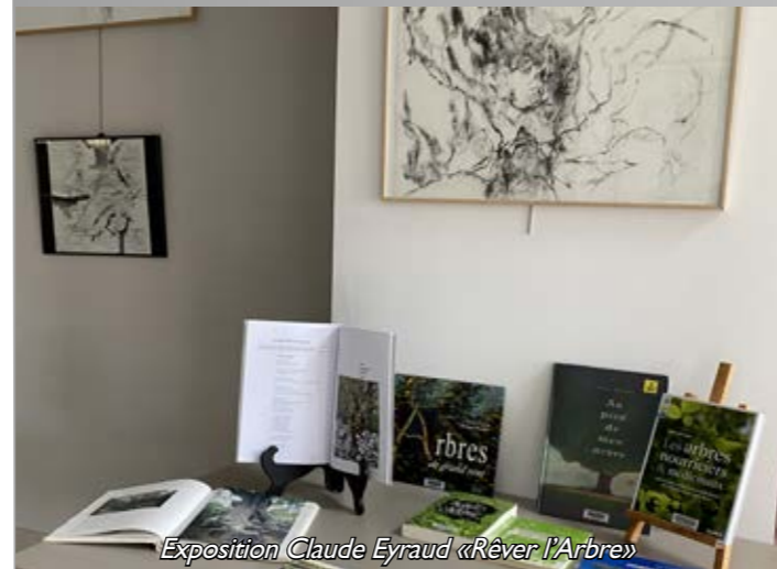
Exposition Claude Eyraud «Rêver l'Arbre»