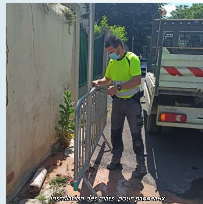
Installation des mâts pour panneaux