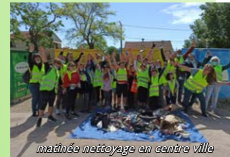
matinée nettoyage en centre ville