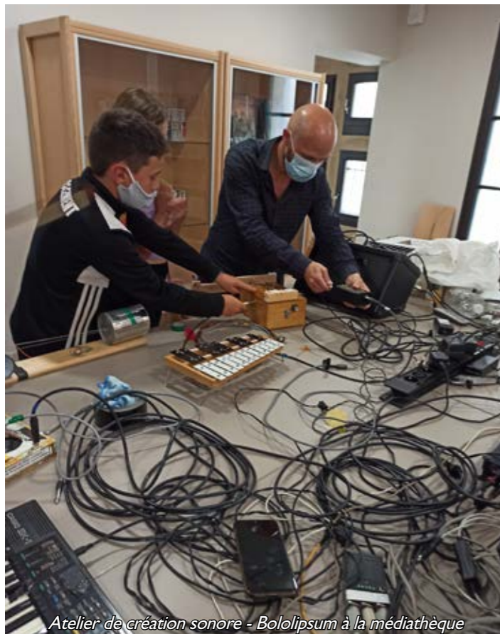
Atelier de création sonore - Bololipsum à la médiathèque