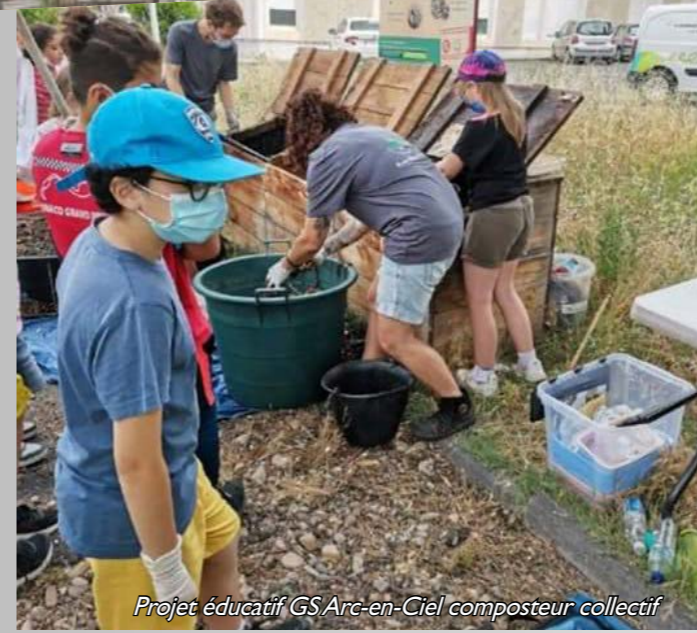
Projet éducatif GS Arc-en-Ciel composteur collectif