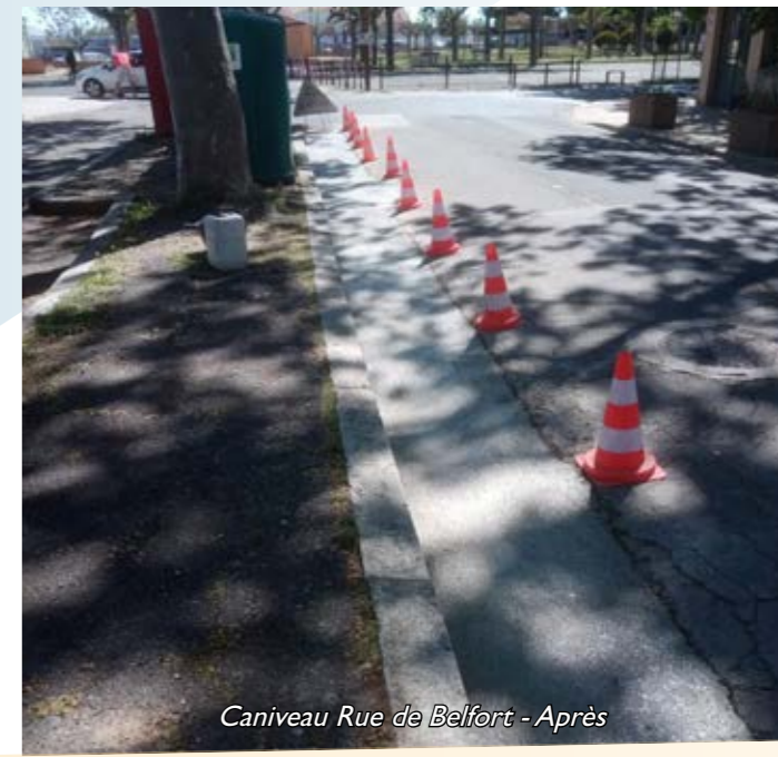
Caniveau Rue de Belfort - Après