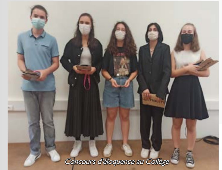
Concours d'éloquence au Collège