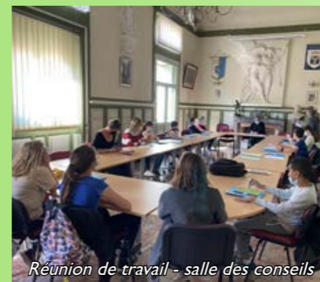
Réunion de travail - salle des conseils

Le groupe Loisirs a organisé une fête de fin d'année pour les élèves de CMI et CM2. Il s'est aussi intéressé à l'aménagement de l'arboretum avec le groupe environnement ; ce dernier a travaillé pour rédiger un projet inscrit aux budgets participatifs de la commune et du département pour l'arboretum et le parcours à partir de la chapelle ND des vertus. Il a proposé également à ses camarades une session «nettoyage du centre ville» (qui sera reconduit à la rentrée) et s'est réuni pour proposer un logo au prochain Conseil prévu le 29 juin.