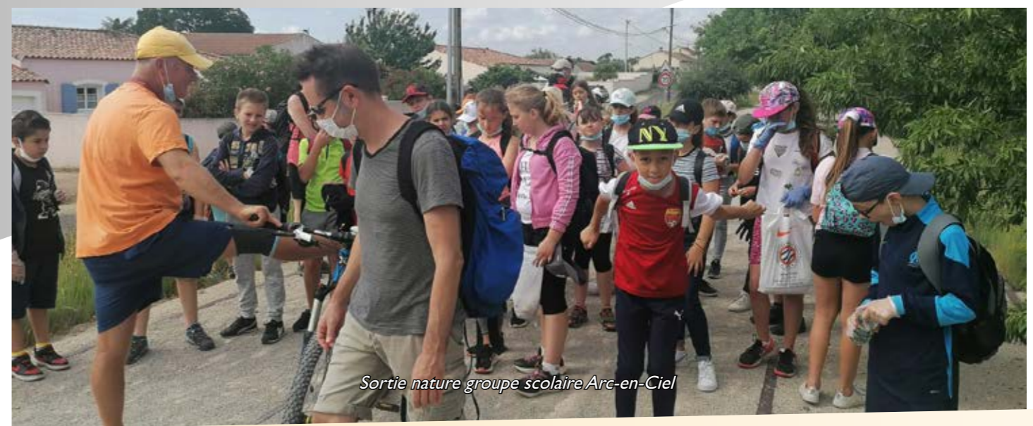
Sortie nature groupe scolaire Arc-en-Ciel