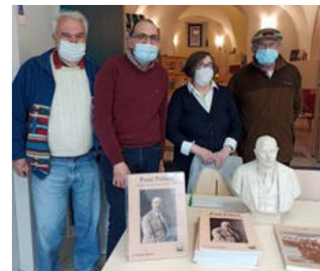
Présentation de l'ouvrage « Paul PELISSE » édité par les Amis de Paulhan

PROCHAINE EXPO DU 6 AU 31 JUILLET «ANIMAGOÛ» PRESENTE DES IMAGES DU MONDE AQUATIQUE REGIONAL PHOTOS DE PHILIPPE CARRIERE