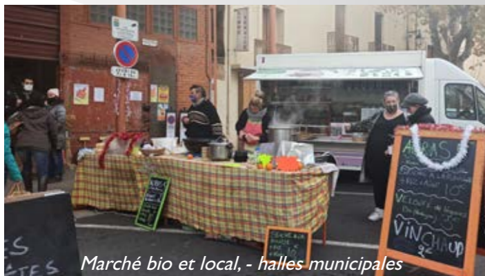
Marché bio et local, - halles municipales