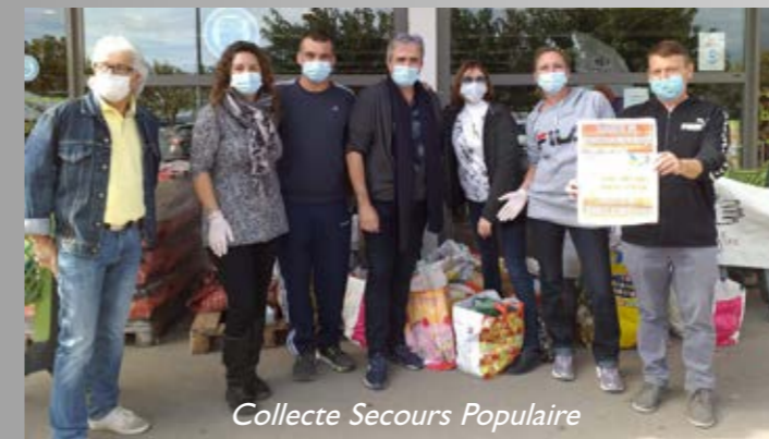
Collecte Secours Populaire