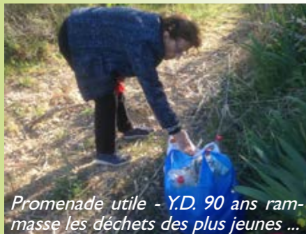
Promenade utile - Y.D. 90 ans ramasse les déchets des plus jeunes ...