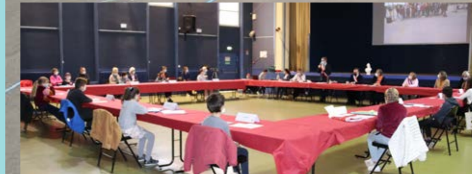
Les jeunes élus se sont retrouvés le 12/12 pour le 1er CME à la salle des fêtes