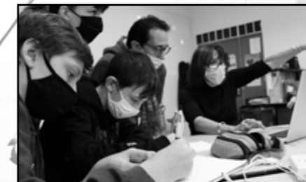
Fenêtre sur cœurs