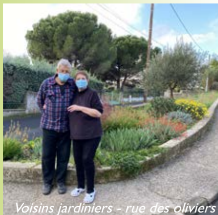
Voisins jardiniers - rue des oliviers

Merci à tous ceux qui prennent soin avec générosité de l'environnement... le leur et celui de leur voisinage ! Lorsque l'on se promène dans la commune, on voit leur travail et c'est réconfortant !