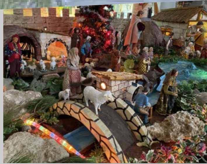
Décoration de Noël Place du griffe