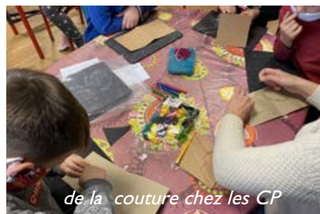
de la couture chez les CP