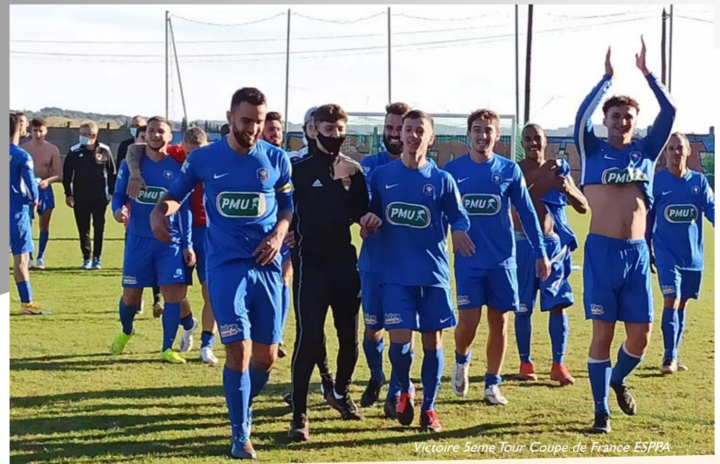
Victoire 5eme Tour Coupe de France ESPPA