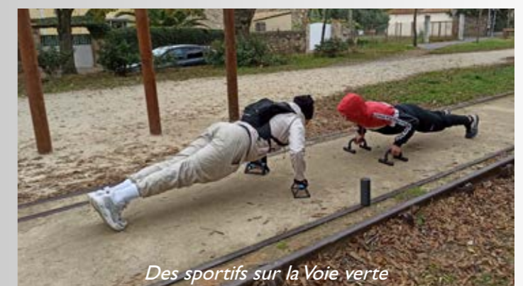
Des sportifs sur la Voie verte