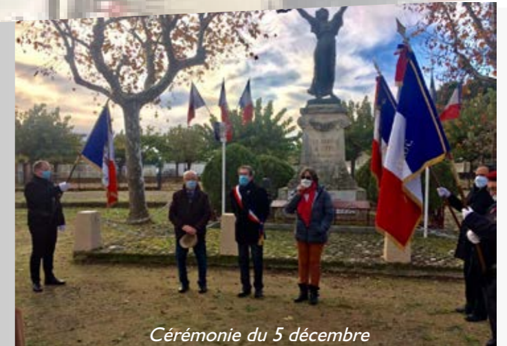
Cérémonie du 5 décembre