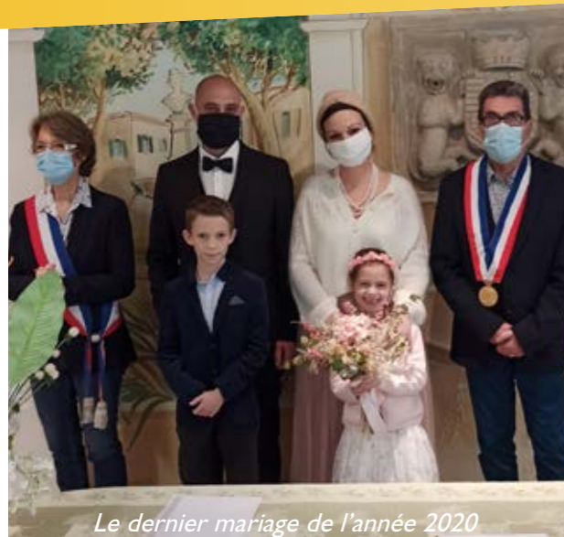
Le dernier mariage de l'année 2020

Attention, cette rubrique paraît 2 fois par an. Un oubli, une erreur? N'hésitez pas à nous le signaler