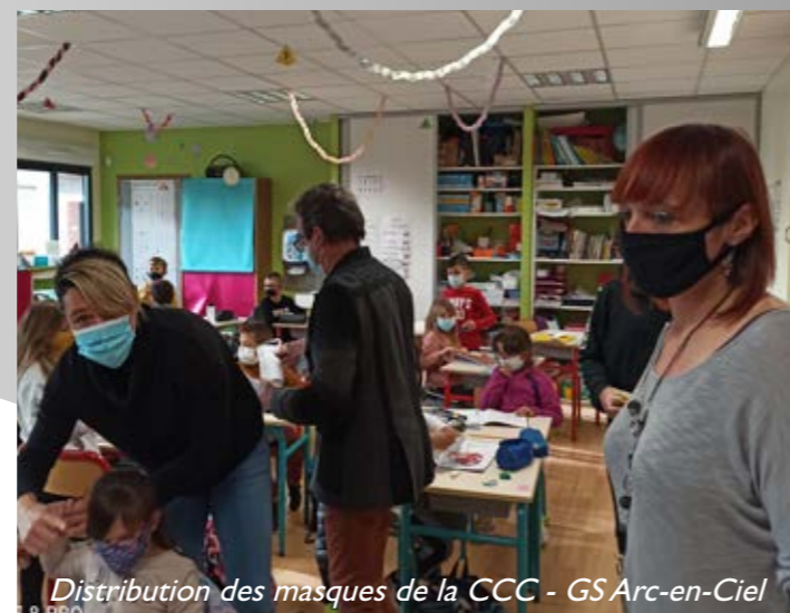
Distribution des masques de la CCC - GS Arc-en-Ciel