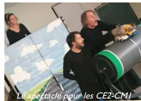
Le spectacle pour les CE2-CM1