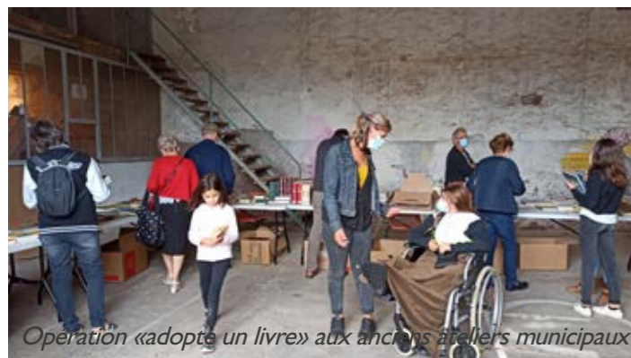
Opération « adopte un livre » aux anciens ateliers municipaux