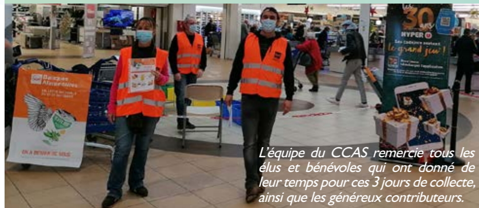
L'équipe du CCAS remercie tous les élus et bénévoles qui ont donné de leur temps pour ces 3 jours de collecte, ainsi que les généreux contributeurs.