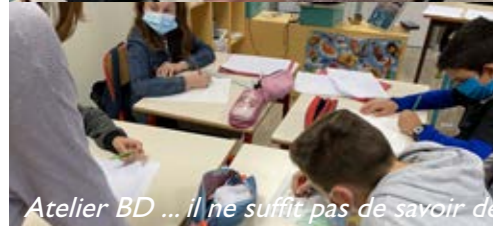
Atelier BD ... il ne suffit pas de savoir dessiner, il faut une histoire à raconter !

En plus de l'organisation des élections au conseil municipal des enfants, l'école Arc en Ciel a été le théâtre d'activités telles que: