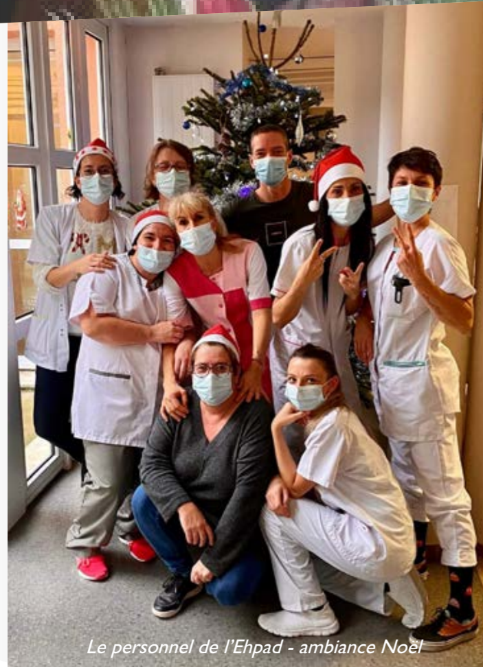
Le personnel de l'Ehpad - ambiance Noël