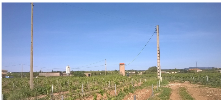
Poste de transformation de type « Tour » et réseaux aériens seront déposés

la dépose des réseaux HTA aériens par l'entreprise locale ALLEZ qui portera une attention particulière aux parties surplombant les vignes. La dépose du réseau BT, quant à elle, ne sera réalisée qu'après les vendanges. La commune de Paulhan bénéficiera ainsi d'une amélioration de la desserte électrique et de la qualité de service grâce à ce bouclage HTA souterrain. En effet les réseaux souterrains, outre leur meilleure intégration dans l'environnement, sont moins soumis aux pannes et en particulier aux aléas d'origine climatique (orage, vent fort, neige collante...). La ligne électrique, qui va être remplacée par le réseau souterrain, avait provoqué plusieurs pannes sur les 3 dernières années générant des coupures importantes sur la moitié de la commune de Paulhan et la totalité des villages d'Aspiran et Bélarga. Le taux d'enfouissement des réseaux 20 kV sur la commune de PAULHAN sera ainsi porté à 95% !